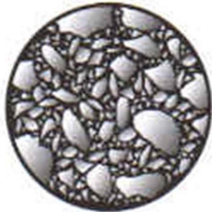
MMA typu AC (Asphalt Concrete)