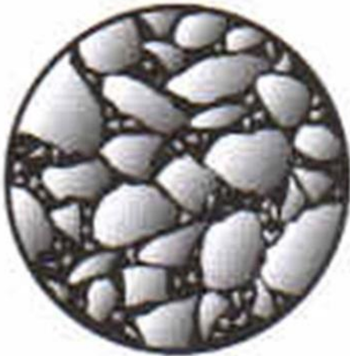
MMA typu SMA (Stone Mastic Asphalt)